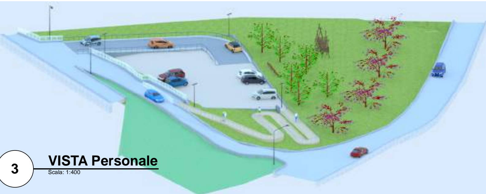
3 VISTA Personale Scala: 1:400