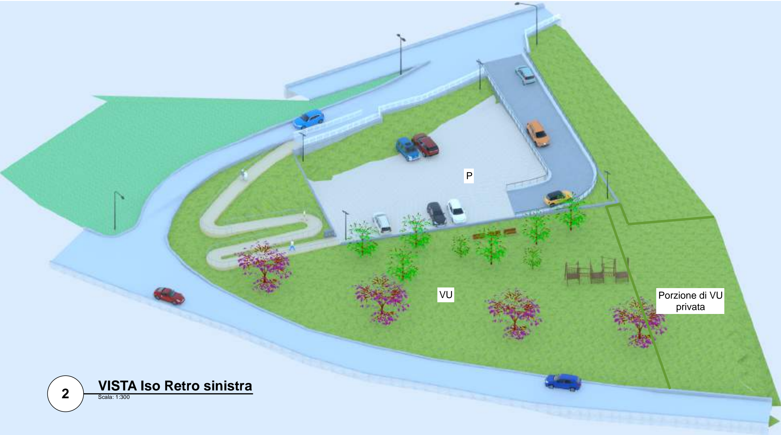
2 VISTA Iso Retro sinistra Scala: 1:300